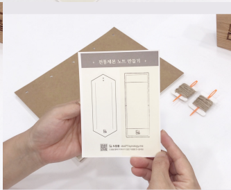
표지 라벨 스티커